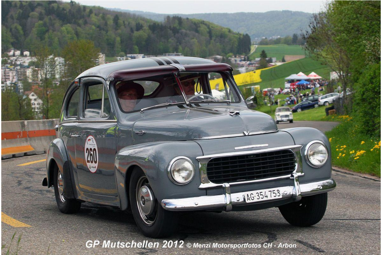
GP Mutschellen 2012